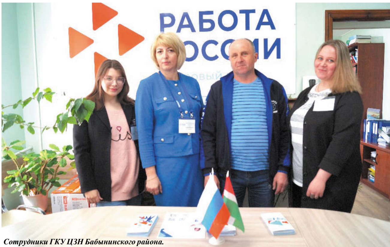
Сотрудники ГКУ ЦЗН Бабынинского района.